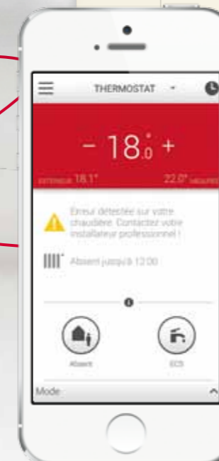
Rappel des besoins de maintenance