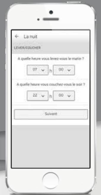
Réglage de la programmation