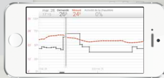
Affichage des consommations