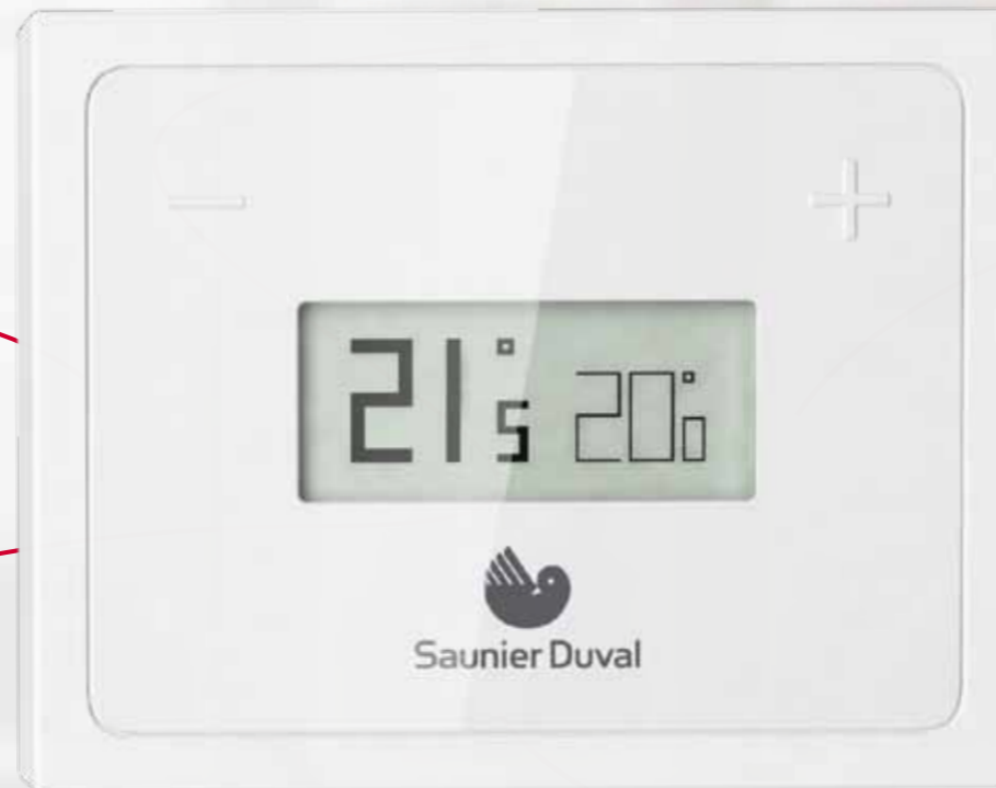
Boîtier d'ambiance. Taille réelle